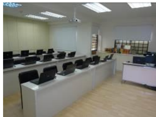
ITスキルを習得するための「ITハブ」