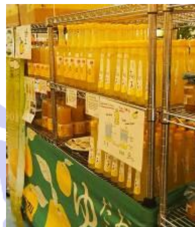
陳列されたゆず製品

物産展にはお酒、お菓子、インスタント商品、冷凍食品等を中心に日本から約 30 社 80 品が集まりました。人気が高かった商品は「ゆず製品」「果物のスナック菓子」「日本酒」等の商品でした。特にゆずはシンガポールでは非常に有名な日本産果物であり、今回もゆずのジュースは商品の説明も不要でよく売れていました。それ以外の売れ筋としてはパッケージや食品そのものが黄色やピンクなど目につくようなものが非常に売れていました。やはり消費者の目に留まるような仕掛けは非常に重要であると思われます。