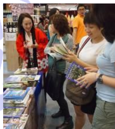
併設された観光情報ブースの PR