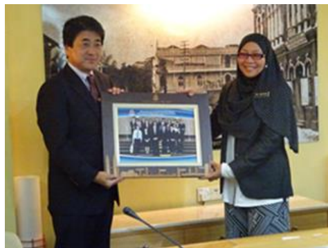
KL 市役所から記念写真の贈呈

首都であり連邦直轄領であるクアラルンプール市では、「クアラルンプール・ストラクチャープラン 2020」にて「A WORLD-CLASS CITY」の都市ビジョンを掲げ、2020年までの都市機能強化のための各種施策を示している。ストラクチャープランを策定する前提としてワークショップを開催し、住民ニーズを把握。市民にフィードバックするシステムを取り入れている。