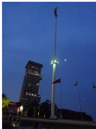
ムルデカ・スクエア

イギリス統治時代には連邦事務局ビルとして使われ、行政の中核として国の重要な行事が何度も行われた場所。