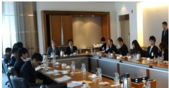
Adif 上席副社長によるブリーフィング

一方、マレーシアにとって、日本への輸出品目の約5割はLNGである。よって、両国にとってLNGは大きな地位を占めており、マレーシアLNGを牽引するペトロナス社と日本との関係は大きい。