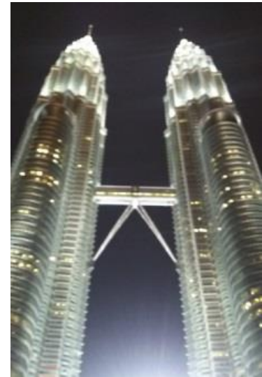
ペトロナスツインタワー

また、ペトロナス社があるペトロナスツインタワーは日本のハザマがタワー1を、韓国のサムスンがタワー2をそれぞれ建設し、人気の観光スポットになっている。