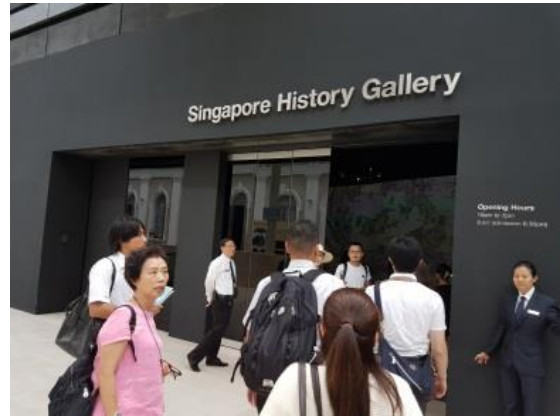
シンガポール国立博物館

「昭南島」と名付けられた3年半の占領時代を日本軍の戦車や日本軍がマレー半島を下ってシンガポールに侵攻した時の自転車群などが展示されていた。