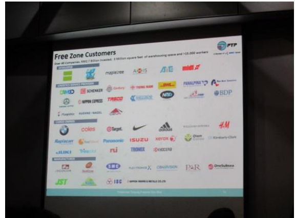
フリーゾーンには日本企業も数社入っている

また、国内の幹線道路、鉄道ともアクセスが良く、取引に関税のかからないフリーゾーンは、各国から 50 社以上による 270 億リンギットの投資があり、1 万 5 千人以上の雇用を創出している。フリーゾーンは 1,500 エーカーあり、現在フェーズ 2 までが完成しており、2025 年までのターミナル 3 の建設にあわせて、フェーズ 5 まで拡張する予定とのことであった。