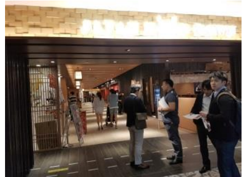
Japan Food Town 入口

2016年7月、シンガポールの中心地であるオーチャード通りのシンガポール伊勢丹（Wisma 店）の4階に日本食の店舗が16店集合したエリア「Japan Food Town（JFT）」が誕生した。JFTは一般社団法人日本外食ベンチャー海外展開推進協会とクールジャパン機構、サポーター企業の共同プロジェクトで、このJFTが初めての事業となる。オープンして約2ヶ月、月に7～8万人が訪れているという。目標は10万人とのこと。