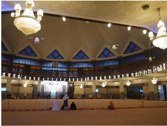
モスク内部の様子