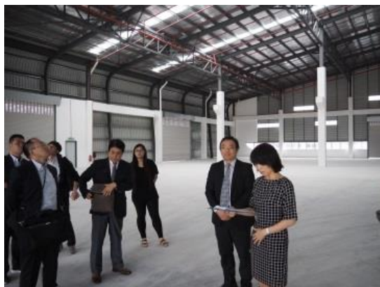
設備済み施設内部視察

設備済み施設の一つを視察したが、非常に環境に配慮したつくりになっており、電力の消費を抑えた工夫（自然光を多く取り入れる、自然の風を通しやすくし工場内の温度上昇を防ぐ等）がされていた。これはシンガポールよりは安いとはいえ、土地代が付近より高いため、環境に配慮しているというより高付加価値をつけることによって、施設を販売しやすくする戦略の一つであるとのことであった。