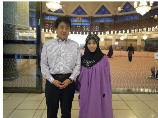
女性はローブとトゥドゥンを着用

高さ 73m の塔はアラーの象徴。オバマ大統領も 2015 年にこのモスクを訪問した。約 3 千人収容可。金曜日午後には 1 万 5 千人程度がお祈りに訪れる。イスラム時間で 1 日 5 回の礼拝を行う。訪問日はイスラム歴 1438 年の 4 日目。イスラム歴のカレンダーはマホメッドが亡くなって 3 年後に作成された。女性はローブの着用が義務なので、入り口ではローブの他、頭に冠るトゥドゥンの貸し出しを受け着用。