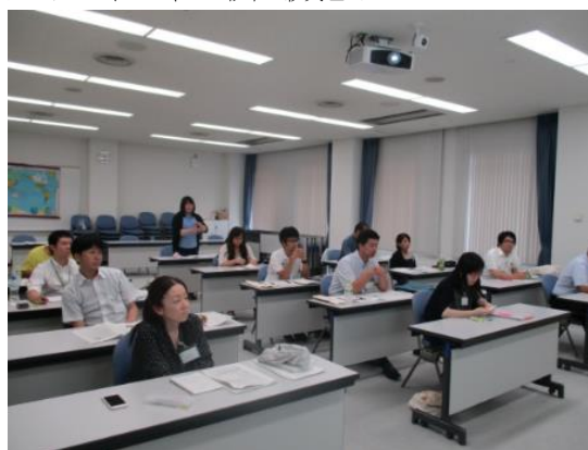
講義を聴講する参加者

2013年のビザ緩和やLCCの就航により訪日人数は大きく伸び、以降順調に伸びている。マレーシアでは雪が人気のあるコンテンツであるため、11～12月がピークシーズンであり、クアラルンプールだけではなく、地方都市からの訪日客増加に向けたPR活動に力を入れている。マレー人のムスリムの中では、日本のハラール対応が十分ではなく、食事に対する不安が訪日阻害要因となっているため、日本が安心して旅行できる国であることを認知してもらうためのPR活動を展開している。マレーシアからの訪日客増加により、東南アジア全体、ひいては他の地域のムスリム訪日客の増加の契機になることを目指している。