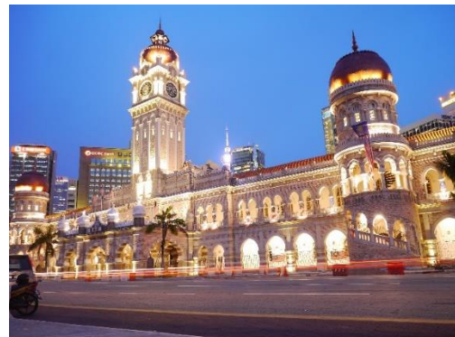
スルタン・アブドゥル・サマド・ビル