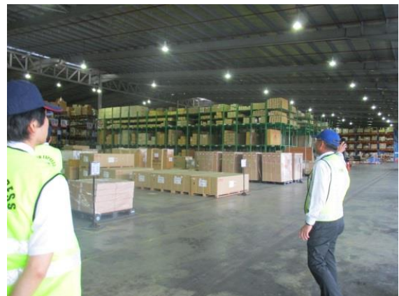
マレーシア日通の倉庫内

また、トラックの洗浄など一定の規律に則った方法で運送を行うハラール物流の認証もっており、今後世界のイスラム教徒を相手にハラール市場でのビジネスも増えてくると考えられる