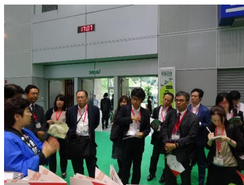
東京都によるブリーフィング

ハイブリットフィルター (煙害、PM2.5にも対応)、バイオマス対応のボイラー、水道管の漏水チェッカー、アスベスト無害化剤、ユニット工法のメガソーラー等