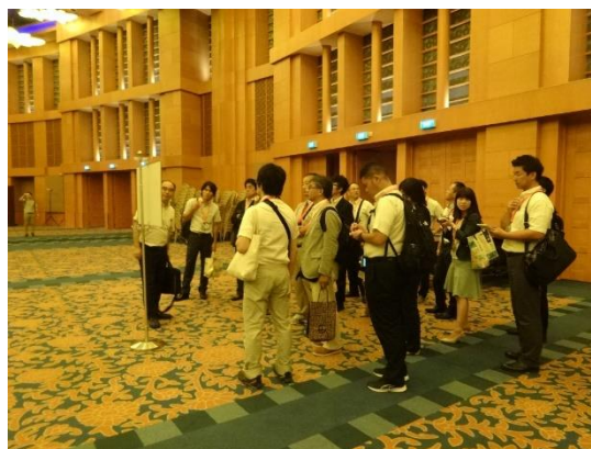
MICE 施設でのブリーフィング

東南アジア唯一のユニバーサル・スタジオ。面積はユニバーサル・スタジオ・ジャパン (USJ) の半分程度だが、アトラクションの数は USJ と同じく 24 あり、そのうち 18 はユニバーサル・スタジオ・シンガポールのオリジナルアトラクションとなっている。