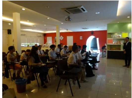
ブリーフィングの様子

3D 職場 (Dirty 汚い、Difficult 難しい、Danger 危険) と言われ、敬遠されがちである。そのため、2～3割がミャンマー、ネパールなどからの出稼ぎ労働者である。多民族労働者の集まりのため、コミュニケーションが難しく、生産ラインへの多言語表示やムスリムの礼拝などに対応した生産計画を立てている。勿論、「味の素」についての都市伝説(髪の毛が抜けやすくなる、身体に悪いなど)についての説明も、天然の原料を使っており、化学食品ではないという、安全性をしっかりと PR していた。