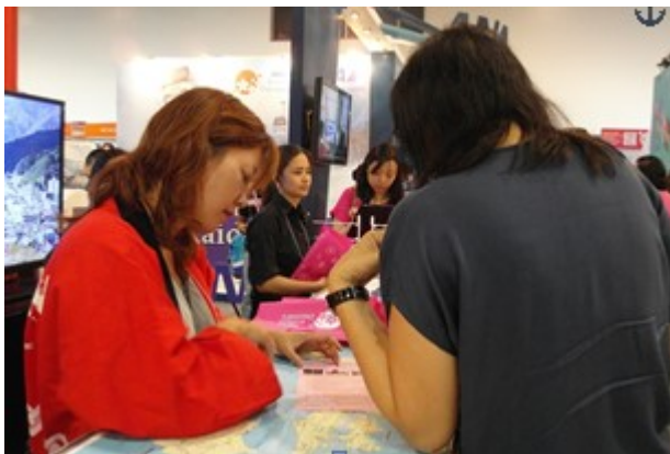
VJ ブースでのスタッフ対応の様子。

「サクラはいつ日本に行けば観られますか」この質問は Visit Japan Pavilion ブース（以下「VJブース」という。）で一番多く受けた質問です。フィリピンの観光シーズンがイースター休暇にあたる 3 月～5 月に集中するため日本への旅行＝桜というイメージが定着しています。多くはゴールデンルート（東京⇄大阪間）上の桜の名所についての質問ですが、4 月末の航空券を手配済みだという方には桜前線についての説明を行い、東北に行けば桜が見られるという情報を提供したところ、非常に喜ばれました。