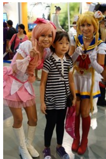
日本のコスプレも非常に人気のジャパ ンカルチャーとして定着している。

訪日旅行の主流がゴールデンルートであり、それ以外の地域についてのイメージが鮮明になっていない同国では、裏を返せば今後の戦略的な売り込み次第で人気の観光ルートとして定着し、多くの訪日客を誘客できる市場ではないかと思われます。また国民の平均年齢が 20 代前半であることから日本が持つ強力なコンテンツである「食」、「四季」、「自然」など以外にも「アニメ、ファッション」など若年層をターゲットにした売り込みも今後検討する必要があると思われます。