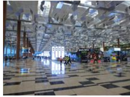
デザイン性の高いターミナルの天井