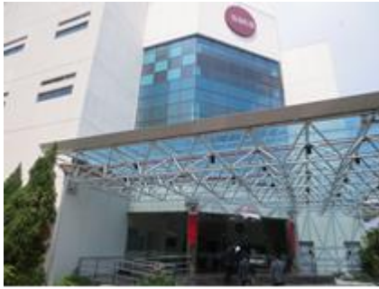
SATSフードセンター2の外観