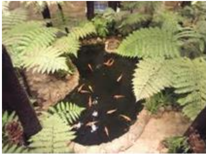
ターミナル内に設けられた鯉が泳ぐ池