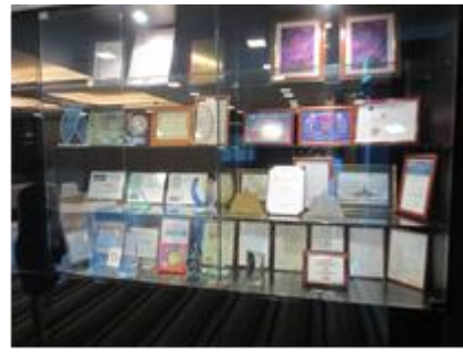
入口に飾られた数々の賞