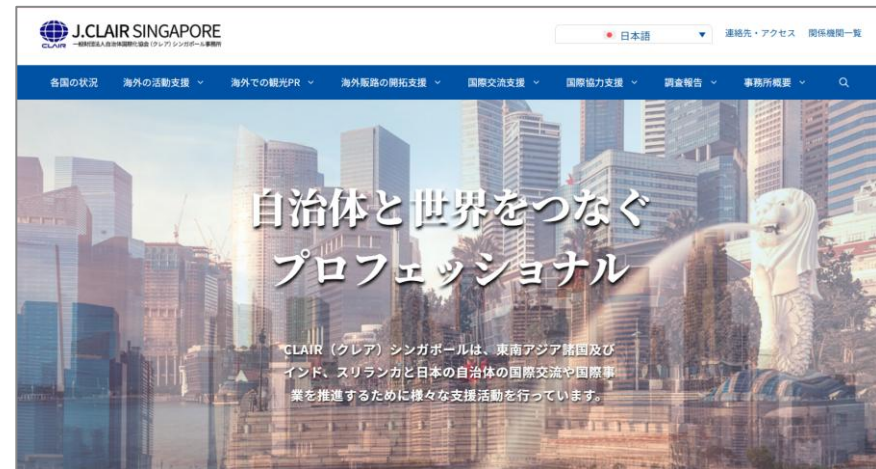
【クレアシンガポール事務所HP】