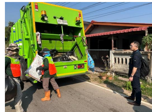
【廃棄物に関する現地指導】 (2025年 タイ)