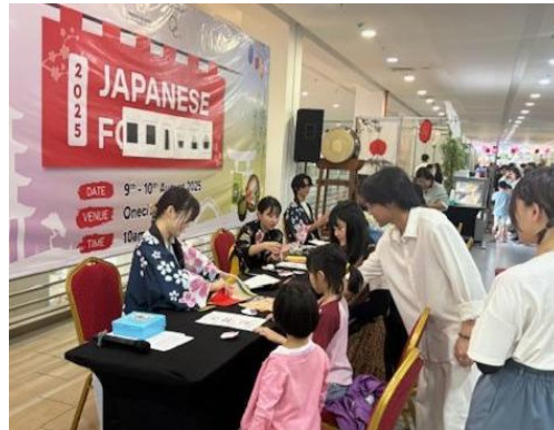
日本文化を発信している様子 (ブルネイ日本食フェア)