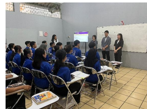
アテンド等支援 in ベトナム・インドネシア (宮崎県)