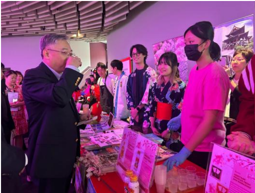
ゆずジュースを提供している様子 (「SAKURA2026」Gardens by the Bay)

現地市場の情勢や特徴のほか、日本の食材や物産に対する現地の反応等を情報収集し、発信していくことで、海外での販路開拓に取り組む地方自治体を支援します。