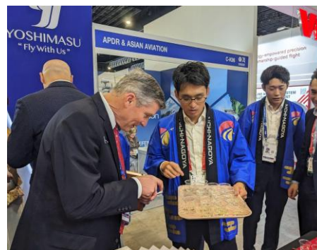
ブース運営支援 in シンガポール (愛知県)