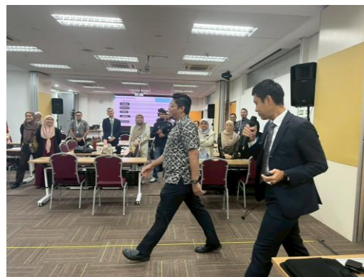
【高齢者福祉についての現地指導】 (2025年 マレーシア)