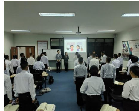
人材送り出し機関の視察 (インドネシア)

また、収集した情報をもとに、東京本部経済交流課と連携し、地方自治体への情報提供を目的としたオンラインセミナーの開催を予定しています。