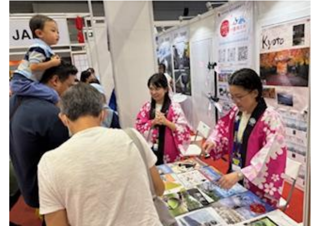
【自治体の観光情報を紹介している様子】