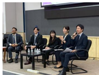
大学セミナーの様子