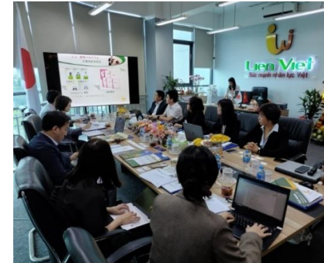
送り出し機関との意見交換 (ベトナム)