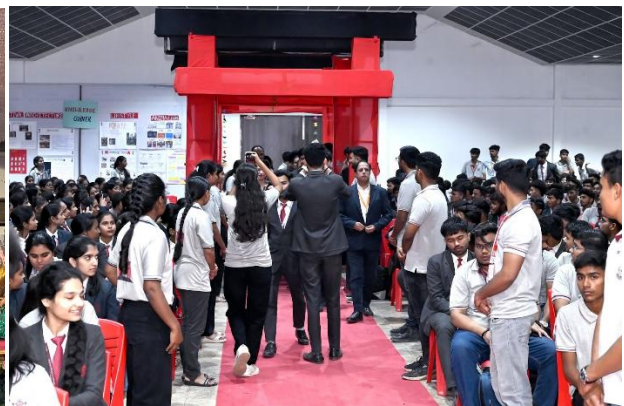
会場入口。鳥居を模したモニュメント