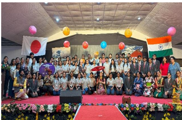
イベント運営委員の生徒・教職員との集合写真

今回の参加を通じて、都市部以外の地域でも日本への関心が高まっていることを改めて感じました。現地の学生が自ら企画・運営に関わり、協力しながらイベントを作り上げる姿からは、日本的な「協働」や「改善」の精神が自然に共有されているように思いました。今後は、より多くの人にこの活動を知ってもらえるよう広報にも力を入れ、クレアとしても引き続き支援していきたいと思えます。「OHAYOU JAPAN」は、日印の新たな絆を築ききっかけとなる、大変意義深いイベントでした。