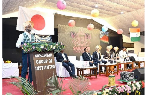
開会式での挨拶をする JETAA インド支部会長