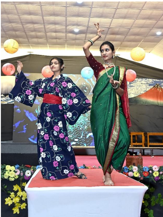
ステージイベントの様子