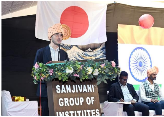
開会式での挨拶をする職員