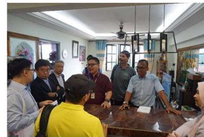
【公営住宅管理についての現地指導】 (2023年、マレーシア)