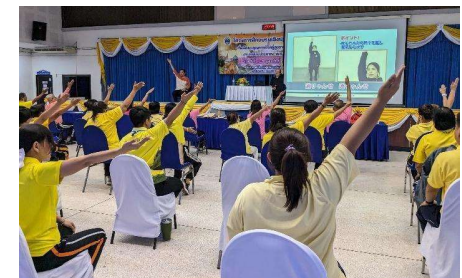
【介護予防に関する体操の現地指導】 (2023年、タイ)