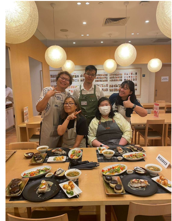
【料理教室の様子(シンガポール)】

レッススタジオでは、使用食材の参加自治体・団体の情報もあわせて提供したほか、シンガポールでは食材の販売も実施しました。レッスンの様子は現地メディア、インフルエンサーを通じて情報発信されました。