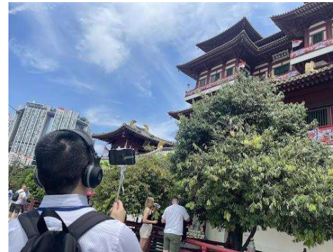
【高校生向けオンラインツアー支援 in シンガポール(埼玉県)】