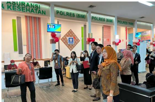
【ワンストップ窓口の説明を受ける参加者(ブカシ市役所)】