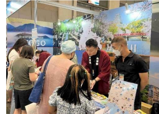
【ブース運営支援 in タイ(兵庫県)】