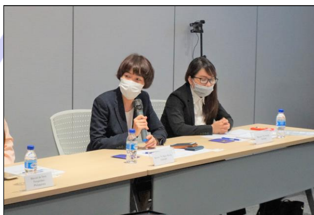
各支部へ質問する参加者

各支部の活動報告の後に行われた質疑応答では「各国の活動の中で人気のある取り組みを知りたい」といった、他国の好事例を自国に取り入れようとする質問や、「国土が広い国におけるメンバー間の連携方法を知りたい」といった、同じ境遇にある支部での課題へのアプローチ方法を学ぼうとする質問などがされました。