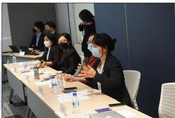
支部の取り組みについて発言する参加者

一方、オンサイトで行われた活動としては、インドネシア支部から、メンバーが学校を訪問し、日本語や日本の文化を学んでいる生徒たちにJETプログラムでの経験などを紹介する取り組みが報告されたほか、シンガポール支部からは、人数を制限して行った太鼓のワークショップなどが紹介されました。