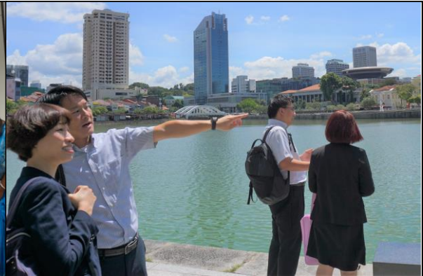
参加者にクリアシンガポール事務所付近を案内する職員