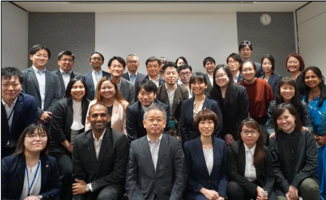
会議参加者の記念撮影

オンラインミーティングが行われるなど、会議をとおして構築された人脈が早速活かされはじめています。また、支部が未開設のベトナム、マレーシアの参加者からも今後の活動に対する前向きな発言も聞かれ、この会議をきっかけに各支部、その他参加国の活動がさらに活発化することが期待されます。クリアシンガポール事務所としても、引き続き彼らの活動をサポートしていきたいと思えます。