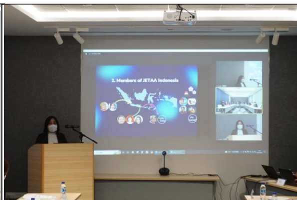
インドネシア支部による活動報告