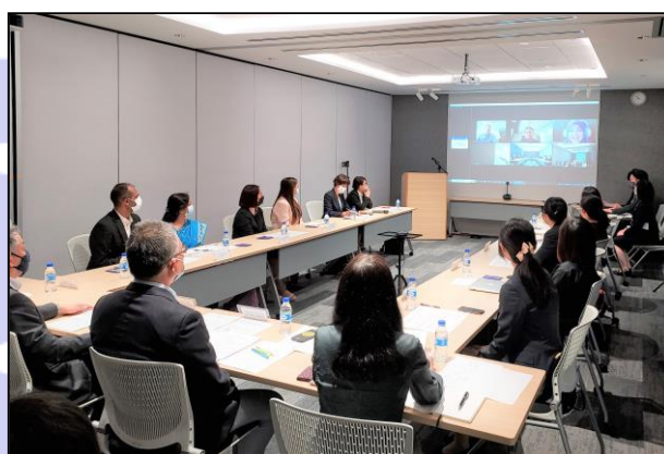
ハイブリッド形式での会議の様子

この会議は、JETAA支部間の連携強化や情報交換などを目的に一昨年度から実施しているもので、新型コロナウイルス感染症の影響もあり、昨年度まではオンラインで開催していました。3回目の開催となった今回は、各国間の往来が可能になったことから、渡航できる参加者はシンガポールで、都合により渡航が難しい参加者はオンラインで参加をするハイブリッド形式で開催することとしました。