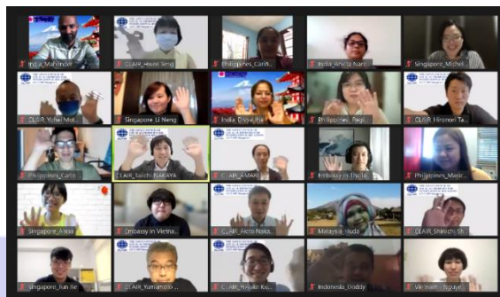
会議参加者（一部）の記念撮影

当事務所としては、日本と各国の懸け橋であるJETAAの活動を今後も支援したいと思います。