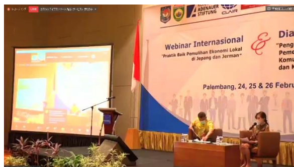
(インドネシアの会場の様子)

2021年2月25日、クレアシンガポール事務所とMOU(覚書)を締結するインドネシア内務省主催のオンラインセミナーにおいて、インドネシアの自治体職員等を対象に、山口県と東京都台東区の職員が「コロナ禍における地域経済及び観光復興」をテーマとした講義を行いました。