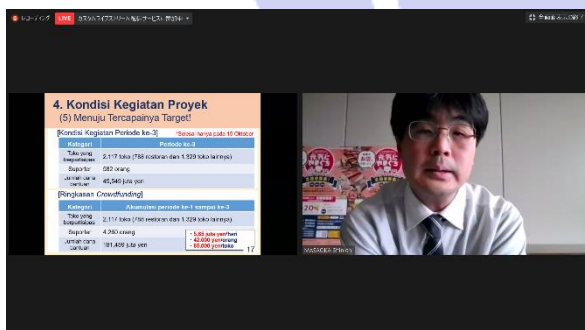
(経済復興の取組について説明する山口県の職員)

台東区の職員からは、区内観光事業者の支援及び観光振興施策として、飲食店テイクアウト等の応援や、インスタグラムを活用して情報発信する「#たいとう愛」キャンペーン、Go To トラベルによる誘客を目指した旅行商品造成商談会など、様々な取組について紹介がありました。