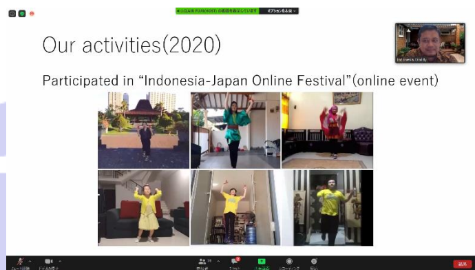
オンラインで開催されたインドネシア・日本祭りについて紹介する JETAA インドネシア支部会長

コロナ禍において各国が困難な状況にある中で、当事務所は、積極的に日本と各国の懸け橋となっている JETAA 各支部の活動を今後も支援しつつ、彼らと協力しながら日本の地域の魅力発信に努めてまいります。