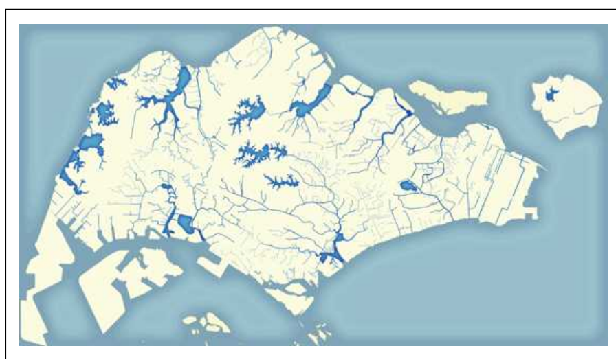
図表 1 「シンガポール国内の水源」

シンガポールは、年間降水量が約 2,400mm に達する多雨地域に位置するものの、国土が狭小であり、最も標高の高いブキティマ高地でも 163m しかない平坦な地形であるため保水能力が乏しく、水源として利用できるような大きな河川もない。他方、シンガポールは狭い国土に 500 万人余りが暮らす超過密都市であり、政府の積極的な産業誘致もあって水需要は増加の一途をたどっている。シンガポールでは、1965 年の独立以来、国内の水源だけでは全ての消費量を賄うことができないため、供給の一部を隣国のマレーシアからの輸入に依存してきた。しかしながら、水の安定的な供給は国家の命運に関わる問題であり、政府は、水源の開発や循環利用の推進に積極的に取り組んでいる。