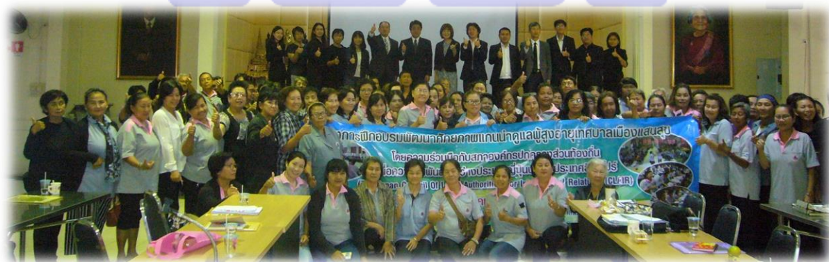
プロジェクトに参加した市民ボランティア