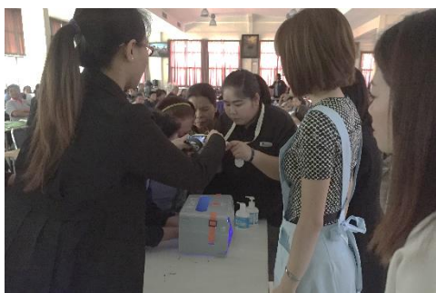
手洗いチェッカーによる指導

今回の専門家派遣事業においても、多くの方の協力を得る事ができました。(1)大田区からは現場の指導や実践に役立つ数多くの介護用レクリエーショングッズ。(2)事業の趣旨に賛同したサラヤ株式会社のタイ工場より石鹸、口腔ケアブラシの無償提供。同社は昨年度の食品衛生