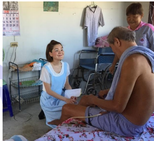
訪問指導を行う専門家

また、施設がないため、現状、高齢者を介護しているのは家族や親戚であり、在宅介護が基本です。そういった家族や親戚、高齢者自身をサポートするために、市民介護ボランティア制度があります。ボランティアと言っても実際には月に600パーツを保健省からもらっていますが、活動時間を考えると、十分な金額ではありません。お金のためではなく、地域のサポートをしたいと思っている温かい人々の集まりです。自主的に登録し、楽しみながら地域を支えている方がタイにはたくさんいます。常時サポートとして活動可能なボランティアは約100名程度ですが、高齢者約6,000人に対して、登録上は600名のボランティアがいます。市民がボランティアで介護サポートをしているため、誤った知識や未熟な技術で介護をしてしまうことがあります。人の愛、温かさはあるが、技術や知識が不足している。そういった市民介護ボランティアに日本の技術や正しい介護指導を行うことが今回の専門家派遣事業のミッションでした。 ベッドでの体位変換、車いすへの乗せ方・降ろし方、足浴、口腔ケアの指導やリハビリの方法など、基礎的事項の指導が、市民介護ボランティアより非常に喜ばれました。