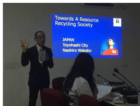
専門家による講義

最先端の廃棄物処理機械を導入したとしても、廃棄物が適切に分別されなければ設備の能力を活かしきれません。また、分別により廃棄物の再資源化が可能となり廃棄物の減量と活用につながります。専門家は、このように廃棄物分別がもたらす効果を説明し、廃棄物分別の徹底が廃棄物管理の基礎を確立するために不可欠なものであることを強調しました。そのうえで、廃棄物分別の種類や指定ごみ袋導入等の豊橋市の事例を紹介しながら、廃棄物を分別するための方策を参加者と議論しながら指導しました。