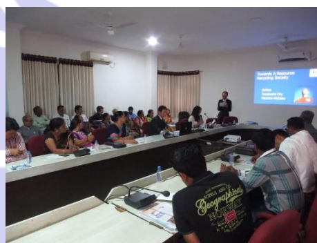
専門家と参加者による議論

また、専門家は、住民の廃棄物管理意識を向上させるための参考事例として、豊橋市の「530（ゴミゼロ）運動」を紹介しました。「530」は「ゴ・ミ・ゼロ」と読み、「ゴミを捨てない」「自分のゴミは自分で持ちかえる」ことによって、住みよいまちづくりを推進する運動で、豊橋が発祥となり全国に広まったことでも知られています。専門家は、コミュニティ活動、環境教育にも言及しながら、「自分のまちは自分達できれい