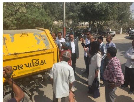
専門家による指導の様子

クリア主催により、2017年2月13日から17日にかけてインドで自治体国際協力専門家派遣事業を実施しました。この事業は日本の自治体を持つ行政ノウハウを海外の自治体に移転し、講義や実技を通じて知識技能を伝える事業です。今回、グジャラート州ポルバンドル市からの要望を受け、廃棄物管理に関する専門家として愛知県豊橋市職員を派遣しました。専門家による指導の様子は現地の新聞等でも取り上げられ、大いに関心を集めました。