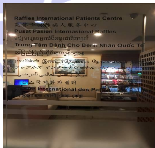
多言語対応センター