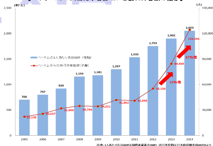
【ベトナムの1人当たり名目GDPと訪日外客数の推移】

指定旅行会社パッケージツアー用一次観光査証発給が開始されました。これらの査証緩和措置により、査証取得の容易さ、団体旅行のハードルが下がるなど、訪日