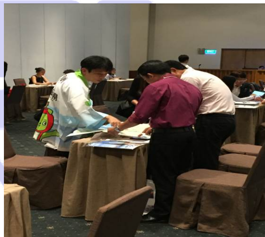
【地図を使用して説明する参加者】

先にも述べたとおり、ゴールデンルートはベトナムで取り扱われる訪日旅行商品の主流であり、人気も高い状況ですが、訪日旅行への需要が高まるなかで、ゴールデンルートに加えた新たな地域への関心も高まっております。現地の旅行業関係者にはゴールデンルート以外の地域の知識・情報が不足しているため、効果的なプロモーション次第では、日本の各地域にとって知名度を上げ旅行者数を増加するチャンスがあります。