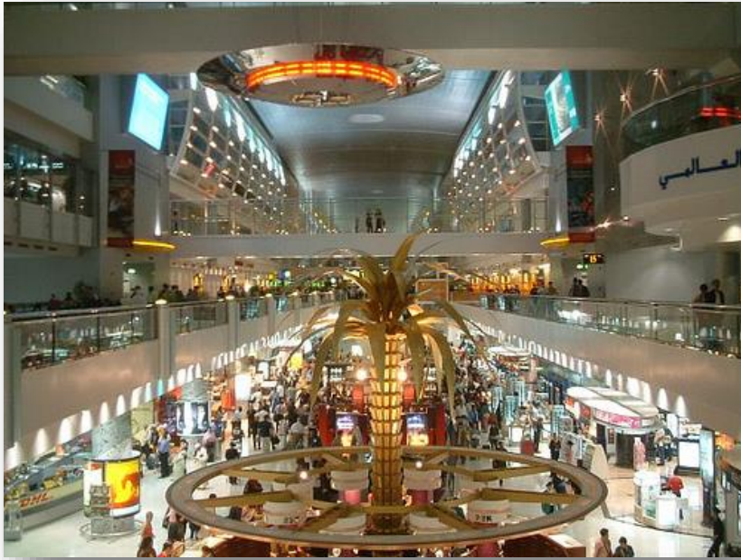
👉 アラブ首長国連邦・ドバイ空港