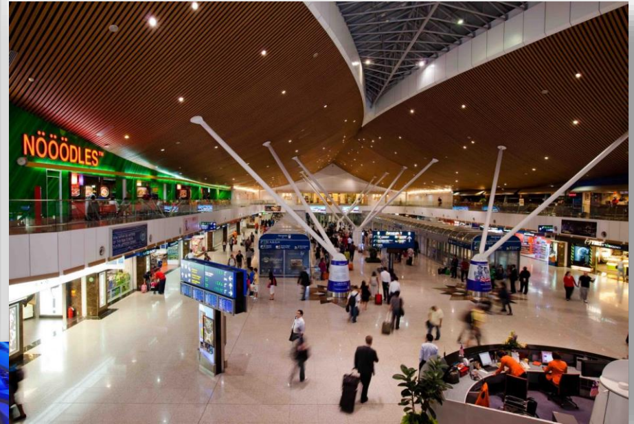
👉 マレーシア クアラルンプール国際空港