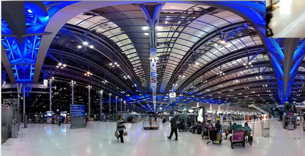
👉 タイ スワンナプーム国際空港