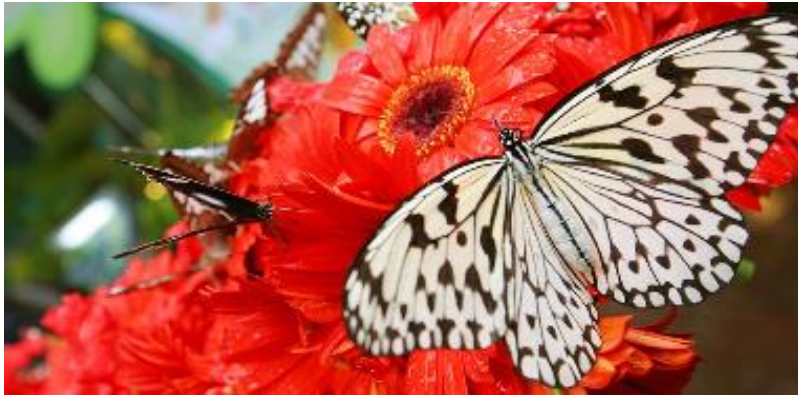
👉 バタフライガーデン