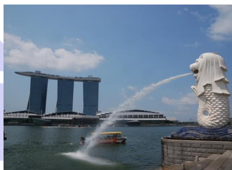
MBSとマーライオン像

2013年にシンガポールを訪れた来訪者は、前年より7.2%増加し1,550万人に上りました。国土面積が小さく、資源のほとんどないこの国にとって、観光は主要産業の1つになっています。広大な自然や歴史的な建造物などが豊富でないシンガポールが、ここまで観光客を増加させたのは、大型テーマパークの造成をはじめとする政府