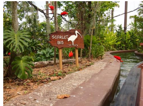
緑豊かな園内と至近距離で観察できる生物 (アマゾンリバークエストの中から撮影)

世界中の 8 つの大河（ミシシッピ川、コンゴ川、ナイル川、ガンジス川、マレー川、メコン川、長江、アマゾン川）を再現したこの施設は、淡水生物専門の動物園として、40 種類の絶滅危惧種を含む 6,000 もの動物や魚が飼育されています。