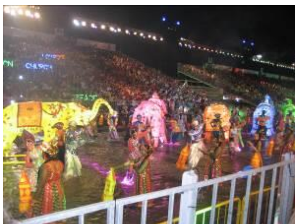
民族衣装でパレードに参加する様子

2015 年は建国 50 周年の記念すべき年でもあり、多くの住民が一体となってチンゲイパレードを盛り上げる取り組みが行われています。