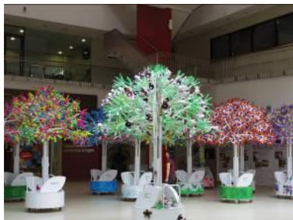
みんなの願いを叶えるツリーの製作

パレードでは各種民族による民族衣装やダンスなどの披露のほか、ダンスが苦手な住民でもイベントに参加できるようペットボトルを使ったカラフルなツリー製作講座や、パティック柄の大きな台紙に好きな色をペイントして作品を完成させる講座など、人民協会本部や地域の CC で子どもから大人まで気軽に参加できる取り組みを行っています。また、これらのイベントには多くの新移民も参加しています。