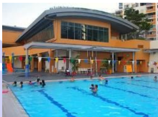
住民の意見でプールを併設したCC

CCの建設には、地域住民のニーズや意見も積極的に取り入れられています。例えば、新たな住宅開発により建設されるCCは比較的若い年代の住民が多いため、住民の話し合いにより家族連れで週末を楽しめるようCC内にプールを設置したケースもあります。また、より地域住民が利用しやすいようにマクドナルドやスターバックス、警察などとの複合施設も建設されています。