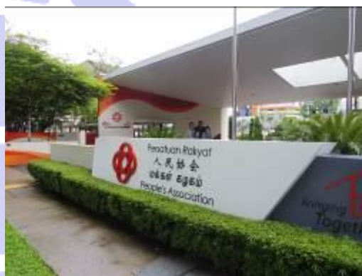
旧学校を利用した PA 本部（外観）

組織規模としては、職員数が 2,700 名で、そのうち 1,600 名が各地域に設置されているコミュニティセンターやコミュニティクラブに配置されています。