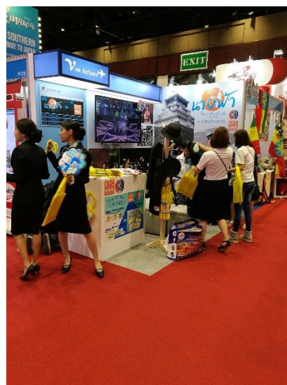
北九州市のブース

ブースのスタッフはキャビンアテンダントの格好をしており、一見したところ航空会社のブースかと思いましたが。市の担当者に話を聞いたところ、北九州市で撮影したドラマをイメージしたブースづくりをしたとのこと。「北九州市」の名前は前面に出てきませんが、ドラマを知っているファンはドラマが撮影された景色を求めて、結果として北九州市を訪れてくれるとのこと。私たちがブースを訪問している間も、子どもから大人まで、たくさんの方がドラマで使用された制服を着て写真を撮っていました。