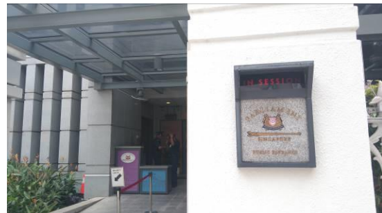
（左：シンガポールの国会外観 右：傍聴席入口）