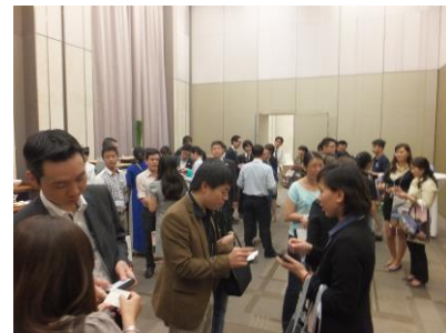
名刺交換会における 日本・ベトナム両出席者の 情報交換・トークの様子 (ホーチミン会場)