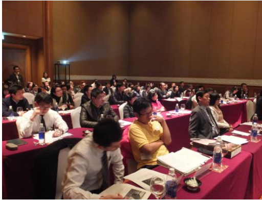
熱心に講師の話を知る セミナー出席者の様子 (ハノイ会場)

会場を埋め尽くしたベトナム側参加者は「東京・大阪・富士山」以外の日本の観光地情報が新鮮に感じられたようで、非常に熱心に聞き入っていました。