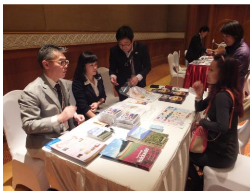
各ブースにおいて熱心なやり とりが行われた各出展者ブース (ハノイ会場)