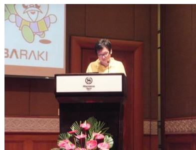
茨城県によるプレゼンテーションの様子 (ハノイ会場)