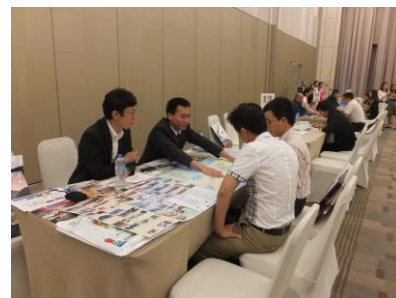
長野県商談ブース (ホーチミン会場)