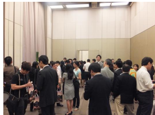
商談会前に行われた名刺交換会の様子 (ホーチミン会場)

セミナーに続いて実施した商談会は、日本側参加者のもとをベトナムの旅行業関係者がまわる形式で行いました。1コマ15分と商談時間を区切っていましたが、短時間で出来るだけ多くの日本側参加者のもとを訪れ、情報交換をしたいと精力的に動くベトナムの旅行業関係者が多かったことと、ベトナム側参加者が途中で帰ることなく終了時間まで熱心に日本側出展者各ブースをまわる姿が印象的でした。