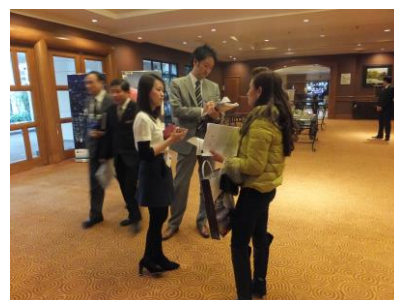
ベトナム旅行業関係者へのインタビューの様子（ハノイ会場）