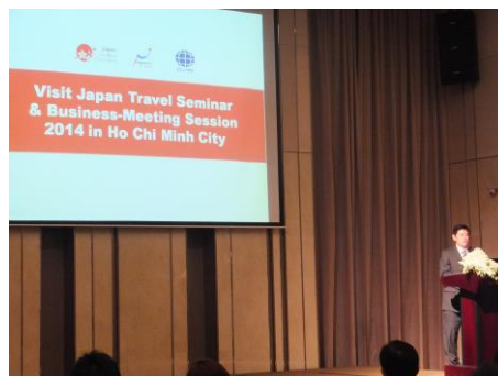
出展者説明会ではベトナム訪日旅行市場の重要性についても多く説明が行われた。 (ホーチミン会場)

このことは、すなわち、日本の主要な観光地以外の情報に乏しい現在のベトナムは、日本の各地域にとって、知名度を上げ旅行者数を増加するチャンスのある国であることを意味しています。同時に、元々親日的であり、国民性も日本人に似ているといった条件に加え、国民所得が年々上昇していること、ビザの要件緩和直後であること、訪日旅行者数が継続的に伸びていることなどの時期的なことを考慮しても、まさに