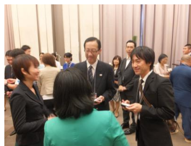
ベトナム旅行業関係者と情報交換を行う東北観光推進機構担当者（ホーチミン会場）