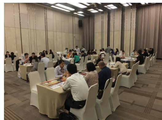
熱気であふれかえる商談会会場 (ホーチミン会場)