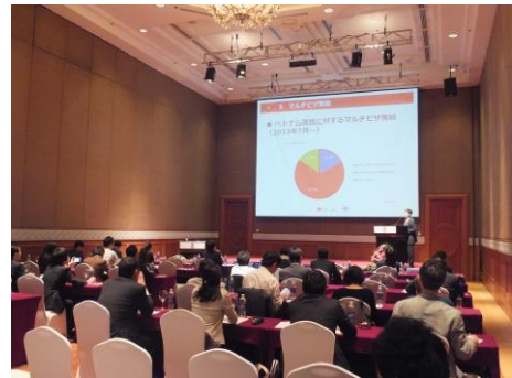
出展者説明会の様子 (ハノイ会場)

ほとんどの日本側出展者が初めてベトナムの旅行業関係者との商談に臨むということもあり、出席者からは「非常に有益な情報を得た」「このような地域特性に関する説明を、他のセミナー・商談会でも行ってほしい」などの意見が聞かれました。