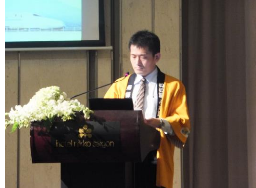
岐阜県による観光地紹介の プレゼンテーションの様子 (ホーチミン会場)