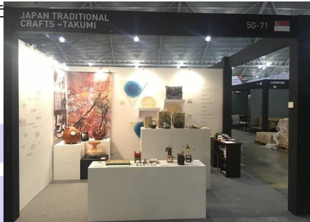
クリアブース「JAPAN Traditional Crafts ～TAKUMI～」

今後もアジアの情報発信のハブ機能を有するシンガポールから日本の伝統工芸品に対する認知度を高め、東南アジア地域への販路開拓に向けて取り組んでいきたいと考えており、平成28年度も出展予定ですので、自治体の担当課におかれましては、ご関心を持っていただけましたら幸いです。案内の詳細は、本年夏以降に、当事務所のメールマガジン、ホームページやフェイスブック等で告知いたします。