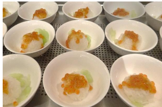
能登棚田米と加賀太きゅうりの浅漬、海鼠腸いくら