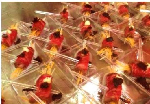
能登牛ランプ肉の昆布締めドライトマト味噌

県産品の海外への販路拡大にあたっては、こうした「継続的な取り組み」が必要不可欠と言えます。