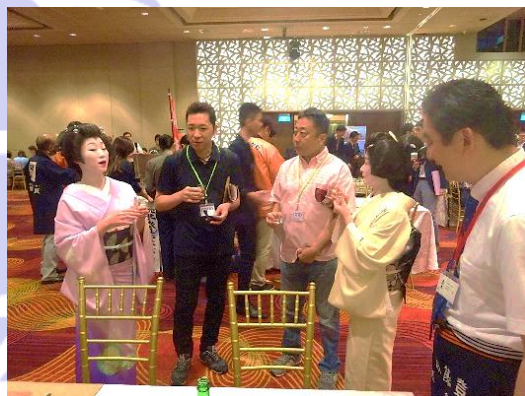
芸妓さんも会場内で石川県産品をPR

石川県は2016年7月にも北國銀行との共催で同種の商談会を開催しました。県の担当者によれば、2度目の開催となった今回の商談会には、昨年に比べ来場者がかなり増えたとのこと。また、昨年度に引き続いて出展した企業の中には、「昨年度出展して以降、多くの問い合わせがあった。それがきっかけで、現地のディストリビューターと輸送コスト等について話し合いをし、やっと今年進出の目途が立った。」と話をする方もいました。