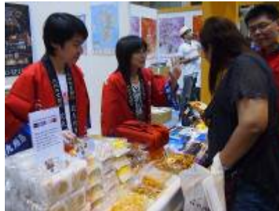
九州の米菓と共に北九州市を PR