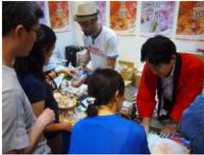
抹茶や和菓子と共に京都を PR

成熟したシンガポールの訪日旅行市場においてインパクトのある地域PRを行うために、物産との連動を検討されてはいかがでしょうか。