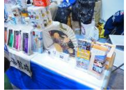
日本橋の名産品と東京都中央区の PR