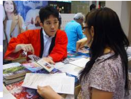
VJブースで観光案内をするクリア職員

(2013年は3日間の開催)。目的地別には、北海道、ゴールデンルートは相変わらずの人気ですが、東北、中部/北陸、中国、沖縄の伸びがかなり大きく、リピーターの多いシンガポールの市場で新たな目的地を求める動きが強まっていることを実感しました。東日本大震災後の2011年に