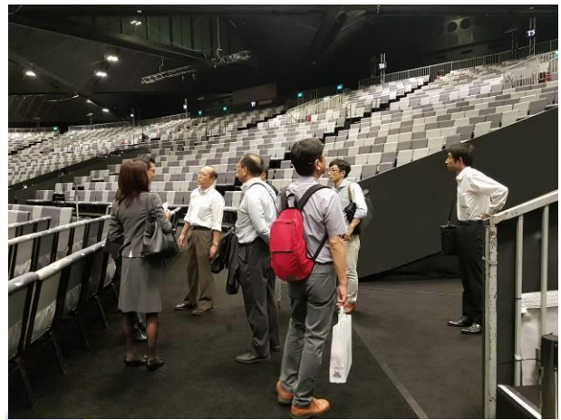
サンテックコンベンションセンターの視察

6Fのコンベンションエリアには2,000㎡の会議室が合計で6つあり、平日は会議利用、週末はキリスト教系宗教団体の集会スペースとして利用され、顧客を安定的に確保しています。また4Fも6Fと同サイズの会議室フロアですが、今回はバックヤードの搬入スペースを視察しました。コンテナを載せたトラックが1Fから直接アクセスできるようになっており、荷物を都度リフトで輸送する必要はありません。