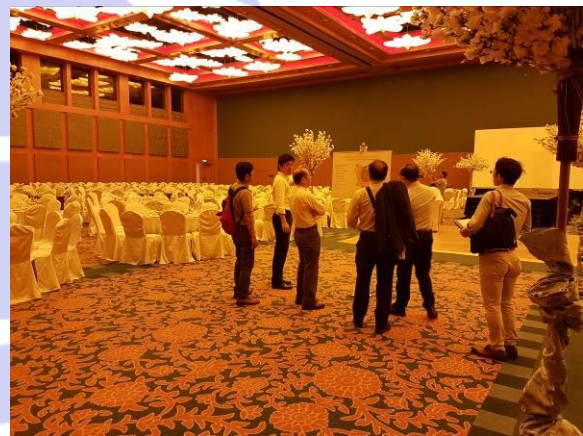
RWS コンベンションセンターの視察

また RWS は 12,000 人の雇用を持つシンガポール最大の雇用者ですが、そのうち約半数はシンガポール国民を雇用しており、国民の雇用の確保にも貢献しています。日本で IR を推進する際にも、訪日観光客をターゲットにした戦略の推進だけでなく、自国民また地域住民への様々なケアが必要になりますが、RWS がそういった課題を見事にクリアしている一例といえます。