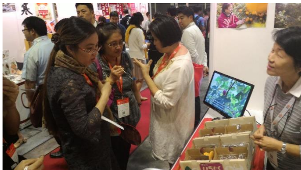
にぎわう東海市ブース

しかし一方で、今回紹介したイチジクの生産者は、生のイチジクは、熟れやすく、傷みやすい果物であるため、輸出に際し多くのケアが必要となってくること、また、ピューレについては、はみ出し品（熟しすぎているものや見た目が悪いもの）をもとに加工しているため、安定した量・味の商品を製造することが困難であることなどの課題を発見しました。これらをクリアすることで、今後の販路拡大に繋がることが期待されます。