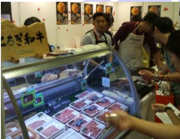
とちぎ和牛のショーケース

にっこりは栃木県産の品種の梨で、なんといっても大きな果実が特徴です。大きいものでは重さが1kg以上もあり、来場者はその大きさに驚いていました。ただ大きいだけではなく、梨の甘さとシャリシャリとした食感をしっかりと味わえることも魅力です。にっこりは、今後シンガポールでも販売が開始されます。シンガポールには、手に入りやすい値段の他国の梨が多く流通しているので、他の商品との違いをアピールし独自の魅力を定着させることで、販路拡大につながっていくと思われます。