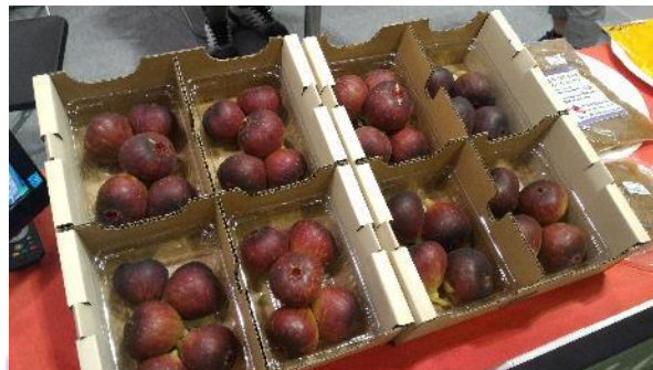
東海市産のイチジク