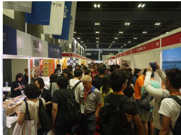
来場者でにぎわう会場

今年で6回目となる日本食の総合見本市「Food Japan 2017」が10月26日から28日の3日間、シンガポールで開催され、日本（38都道府県）、シンガポール、香港、タイ、マレーシア、インドネシアから283社・団体が出展しました。日本の自治体からは、青森県、栃木県、愛知県東海市、京都市、山口市、山口県下関市、香川県、鹿児島県いちき串木野市等が出展し、初日から来場者との間で活発な商談が行われました。会場では、全国各地からの目新しい商品に注目が集まったほか、ハラール認証を取得したカレーや動物性成分が入っていないベジタリアン向けラーメンなど、多民族・多宗教国家であるシンガポールを意識した商品が関心を引いていました。