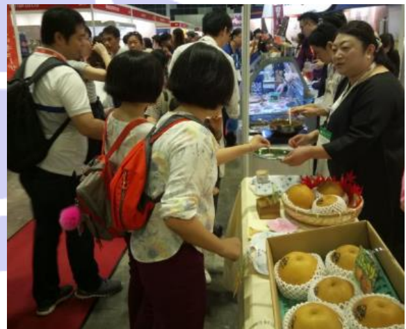
大きな梨に興味津々