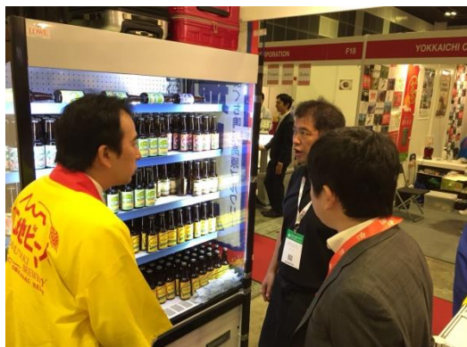
山口地ビール ブースの様子

いずれの事業者もこのたびの出展を通じて売り込み先が明確になったことで、今後の海外展開に繋がることが期待されます。