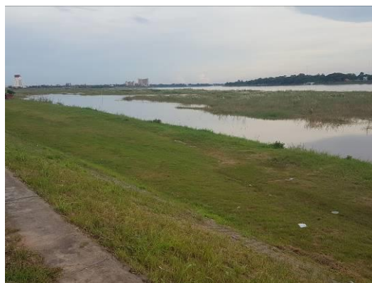
ラオスの農業を支えるメコン川

また、ラオスでは安定した雨量、肥沃な土地を背景に農業が盛んです。ラオス政府は食品加工など付加価値の高い農業生産を目指し、オーガニック栽培などを奨励しています。最近ではラオス南部のボラベン高原を中心に農業に関連する幅広い経済活動を行う「アグリビジネス」に注目する日本の企業、自治体も増えてきており、徐々に進出してきています。今後の成長が見込まれる分野の一つといえます。