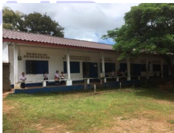
(新居所長補佐 江東区派遣)