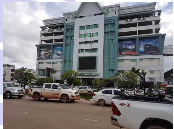
ビエンチャンにある大型ショッピングモール

また、訪日旅行については、ラオスと日本との間に直行便がなく、ビザも免除となっていないため、まだ一般的ではありませんが、今後の経済成長に伴う伸展が期待されます。