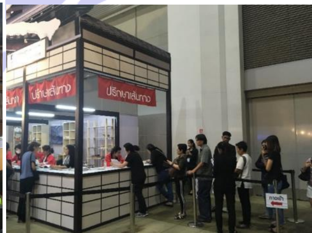
相談ブースには長蛇の列が