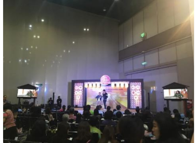
タイの有名人による日本紹介