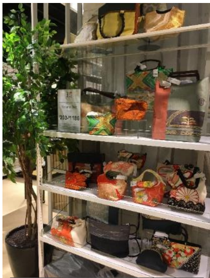
着物の素材を使ったバッグ

昨年は日本の伝統的な工芸品を紹介しましたが、今年の商品のテーマは、「 Stylish, Craft, Functional スタイリッシュ、手作り、機能的」であり、従来の工芸品に付加価値をつけたようなものが多くみられました。日本食の広がりとは比べ、シンガポールにおける日本の伝統工芸品の知名度は低いのが現状ではありますが、シンガポールのデザイナーとコラボレーションをし、現地の趣向を取り入れるなどした商品を展開することで、シンガポールでの販路開拓の足掛かり、そして地域のものづくり振興に寄与することが期待されます。