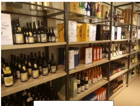
豊富な種類の日本酒

売り場は4階の食品を扱うコーナーと5階のファブリックや家庭用品などを扱うコーナーに分かれ、豊富な種類の日本酒から、昆布などの乾物類、金平糖などのお菓子、食器類、スカーフ、和小物、髪飾りなどの商品が陳列されました。中には、着物の素材を使ったバッグや、撥水性に優れた風呂敷など、伝統的な日本の製品に、現代的なアレンジを加えた商品も見られました。