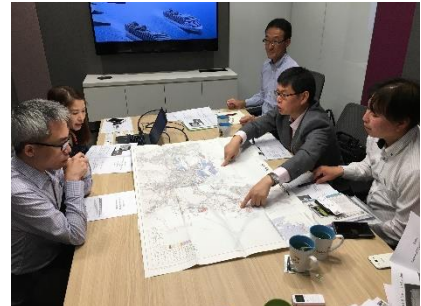
チャンギ空港の方に地図を 使って説明する様子

今後もクレアシンガポール事務所は、自治体の海外活動をサポートしてまいりますので、当地での活動をご検討される際には是非当事務所までご相談ください。